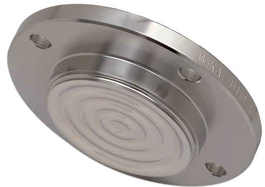
Separatore a membrana con attacco sterile, modello 990.60

Il separatore a membrana modello 990.60 con connessione NEUMO BioControl® è particolarmente adatto all'uso in processi sterili ed è adattato al processo tramite custodia