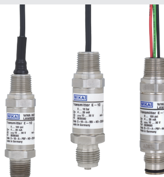
Пример применения: Преобразователи давления моделей E-10 и E-11