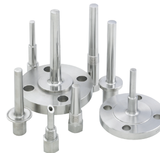
Защитные гильзы различных конструкций