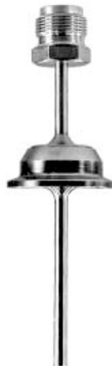
Защитная гильза с асептическим присоединением Модель SW200F

Диа. 6 x 1 мм и диа. 6 x 1.4 мм для штока диа. 3 мм с электрическими термометрами 2) Диа. 8 x 0.9 мм для штока диа. 6 мм с электрическими и механическими термометрами Диа. 12 x 1.5 мм для штока диа. 8 мм с механическими термометрами