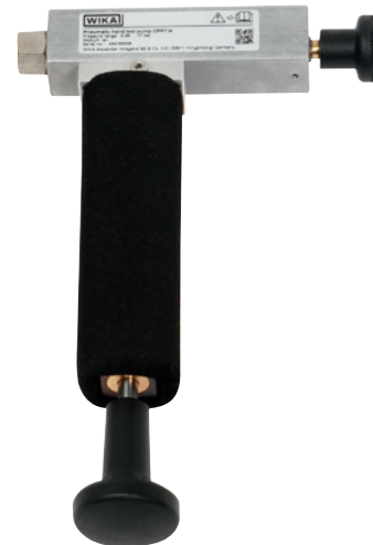
Bomba de prueba manual neumática modelo CPP7-H